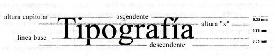
Diagrama del tamaño de letra

Los datos incluidos en la etiqueta deberán indicarse con caracteres claros, bien visibles, indelebles y fáciles de leer para el consumidor en circunstancias normales de compra y uso, para ello se deberá utilizar caracteres cuya altura no sea inferior a un milímetro (1 mm), entendiéndose dicha altura como la distancia comprendida desde la línea de base hasta la base superior de un carácter en mayúscula, para lo cual se recomienda el uso del modelo básico que se presenta en el anexo B del decreto.